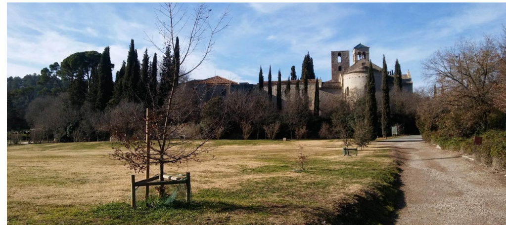
EL MONESTIR BENEDICTÍ SANT BENET DE BAGES

RUTA FAMILIAR PER MÓN SANT BENET SEGUINT EL LLOBREGAT I LA RIERA DE MURA. VISITARÀS ALGUNES TINES DE PEDRA SECA I EL PASSAT VINÍCOLA DEL TERRITORI.