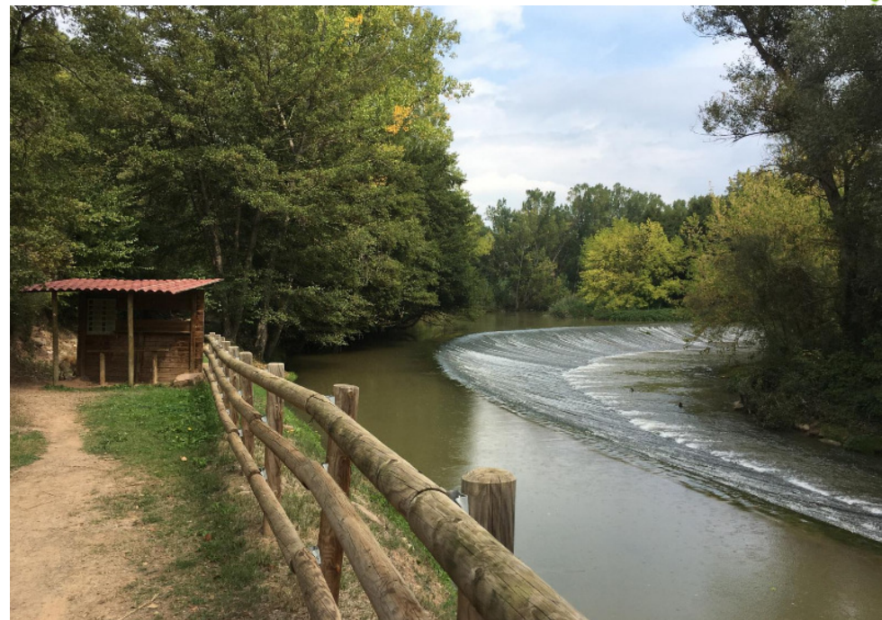
RESCLOSA DELS MANRESANS (L'INICI DE LA SÈQUIA)