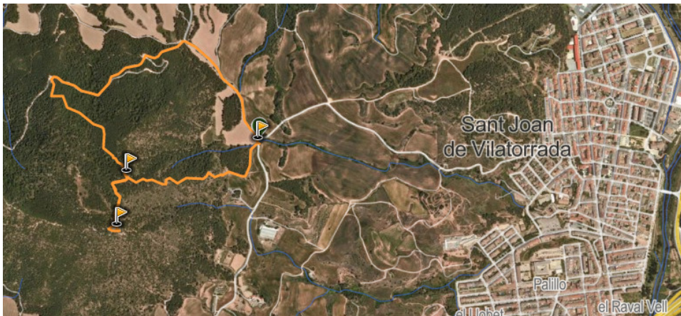
LES VISTES DES DEL CIM DEL COLLBAIX

↔ 3,14 km ↻ Sí ↗ 244 m ↕ 534 m ↘ 244 m ↓ 301 m △ Fàcil