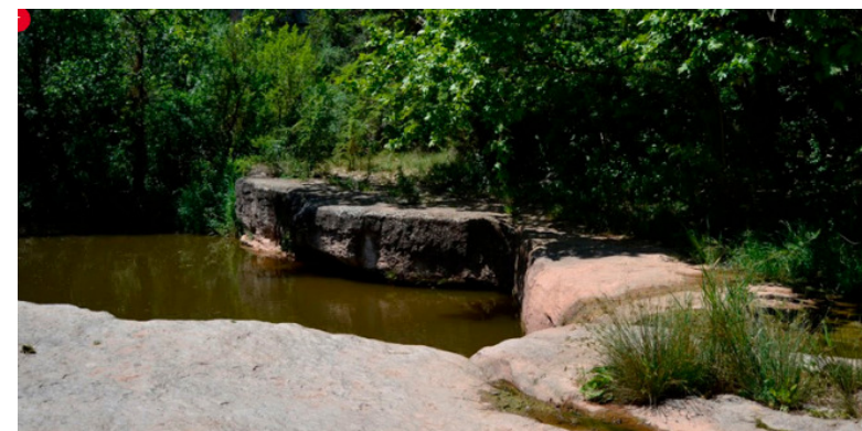
LA RIERA DE RAJADELL

CAMINADA COMPLETA, COMBINA BONES VISTES I GORGS PRECIOSOS, A MÉS D'ELEMENTS TANT DIVERSOS COM BARRAQUES DE VINYA, UN POU DE GEL, UNA TORRE DE DEFENSA O UN POSSIBLE CAMÍ ROMÀ.