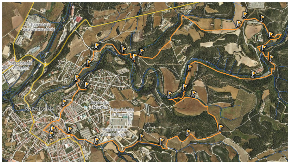
FONT DE L'ANGLE