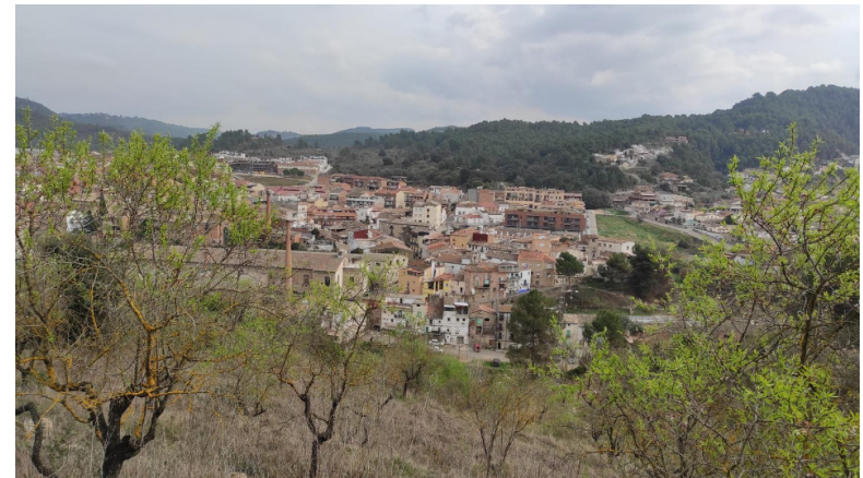
VISTES DEL PONT DE VILOMARA

RUTA GEOLÒGICA PER DESCOBRIR EL PASSAT I PRESENT GEOLÒGIC DEL MUNICIPI I VEURE COM LES PEDRES, SEDIMENTS I ESTRATS ENS PODEN EXPLICAR MOLTES COSES.